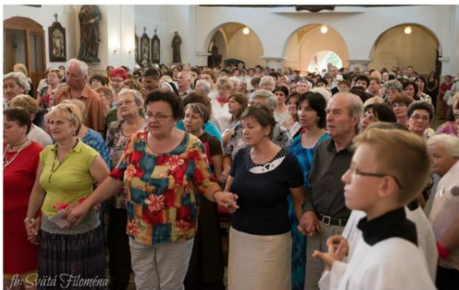
fr. Svätá Filoména