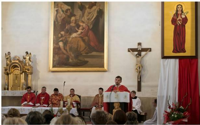
Arcibratstvo sv. Filomény - centrum pre Slovensko v Spišskom Podhradí